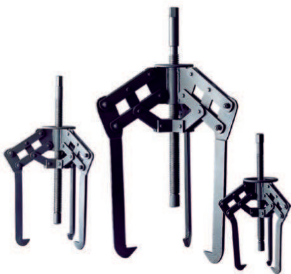
Мощные самоцентрирующиеся механические съёмники

Наиболее эффективным способом демонтажа мало- и среднегабаритных подшипников качения является использование механических съёмников. Съёмники SKF обеспечивают отсутствие повреждений как подшипников, так и сопряжённых с ними поверхностей при демонтаже. Съёмники SKF просты и безопасны в работе.