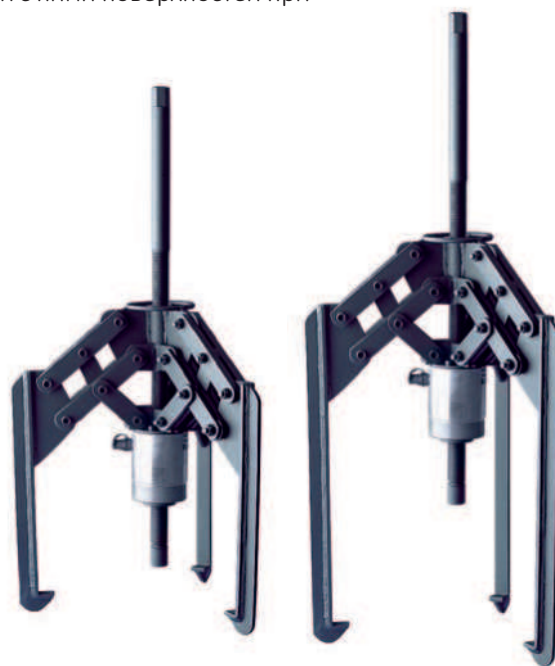
Мощные самоцентрирующиеся гидравлические съёмники